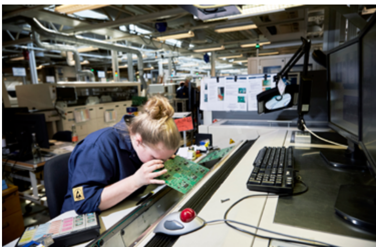
Elever kan få SPS-støtte til både psykiske funktionsnedsættelser eller til fysiske funktionsnedsættelser

Der er ikke en "one size fits all". Det er vigtigt, at den enkelte lærling får den støtte og vejledning, der er behov for. Det er den enkelte erhvervsskole, der er ansvarlig for at søge støtten hos Børne- og Undervisningsministeriet under samtykke fra lærlingen. Støtten kan bl.a. være i form af støttetimer, som virksomheden fakturerer til skolen. Det første skridt til at søge SPS-støtte er derfor, at lærlingen henvender sig til erhvervsskolens SPS-ansvarlige eller studievejleder.