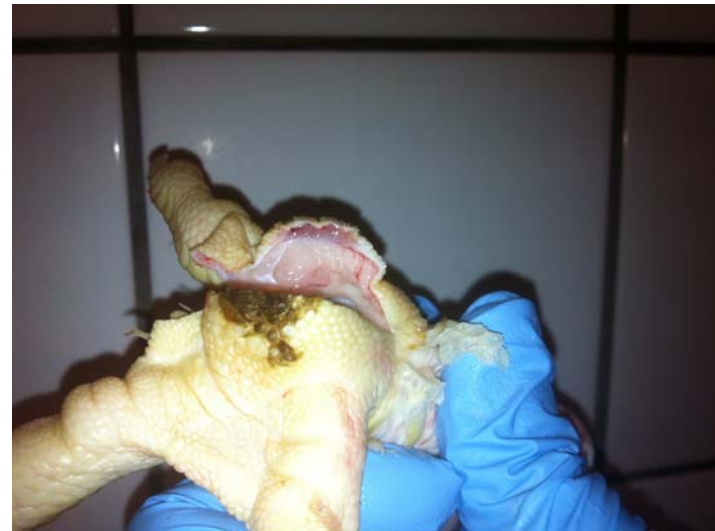
Ved gennemskæring ses at underhuden er intakt for størstedelen af trædepuden = score 1? Tændstikhoved?