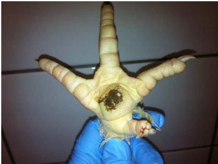
Tydelig ætsning af overhuden = score 2